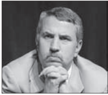
Thomas L. Friedman